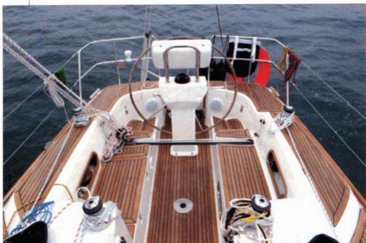
Le cockpit aux lignes sages est très fonctionnel en mer. On apprécie les vide-poches dans les hiloires.

sous le vent, on profite d'une vue parfaite sur les penons du foc et sur l'étrave. Mais l'on peut également barrer debout. On remarquera que le winch de foc est réellement à portée de main. Il ne doit pas être difficile de tirer des bords en solitaire. En équipage, cette position très reculée des winches de génois nous semble moins convaincante : il est toujours dommage de tourner le dos à la voile que l'on règle et, lorsque le chariot d'écoute de grand-voile est sous le vent, la manivelle de winch peut se