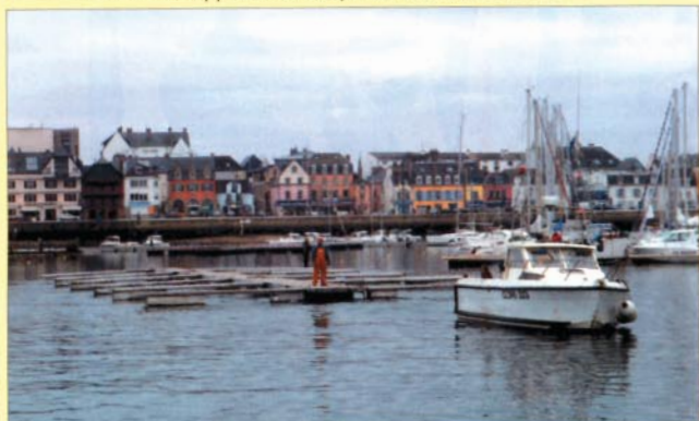
Des pontons qui s'en vont... mais pas à la dérive! De nouvelles installations seront en place au printemps.

C'est un port curieusement vide qui nous attendait à Concarneau. Et pour cause, l'ensemble des pontons du port de plaisance (qui ont eu plus que leur part de coups de vent) est renouvelé cet hiver. Des travaux très importants (on parle d'un million d'euros) qui doivent redonner un coup de jeune à un port qui souhaite jouer à nouveau un rôle d'animation dans sa région. Il recevra d'ailleurs le départ de la prochaine Transat AG2R (en avril). En attendant la fin des travaux, une partie des voiliers stationnés à Concarneau a trouvé refuge de l'autre côté de la Ville Close, dans l'arrière-port d'ordinaire dévolu à la pêche. Mais cet arrangement très provisoire ne préfigure pas encore un futur développement de la plaisance dans ce deuxième bassin.